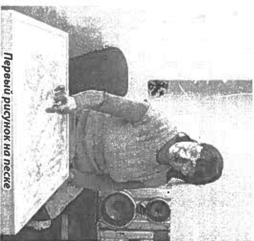
Первый рисунок на песке

В Комплексном центре социального обслуживания населения Балаковского района тоже с благодарностью ждут дорогих гостей. Недавно сотрудники Учреждения провели обследование семей, в которых воспитываются дети-инвалиды. Выявлены были печальные проблемы: социально-психологическая помощь требуется как детям, так и их родителям. Но один только психолог со столь объемной задачей справиться нескоро. В результате в помощь Учреждению была оборудована сенсорная комната. Жаль, конечно, что незрячие не